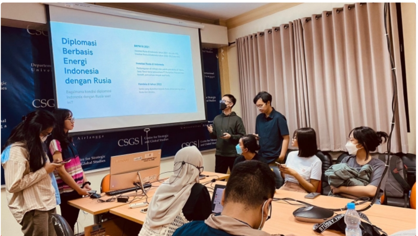
Sesi Presentasi dan Diskusi IRCOM x FPCI Airlangga di Ruang Cakra, FISIP

SURABAYA – Melambungnya harga Bahan Bakar Minyak (BBM) di Indonesia semakin membebani perekonomian masyarakat yang berusaha pulih dari dampak pandemi. Untuk menekan hal tersebut pemerintah didorong mencari alternatif sumber minyak mentah murah. Salah satu alternatifnya adalah membeli minyak murah dari Rusia. Namun, ditengah gejolak politik yang terjadi, langkah tersebut dapat menjadi boomerang tersendiri.